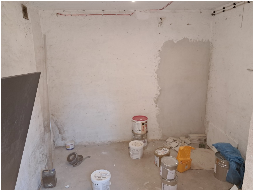
Pomieszczenie magazynu – zaciężone miejsce na ścianie – zamurowany otwór drzwiowy do wykucia