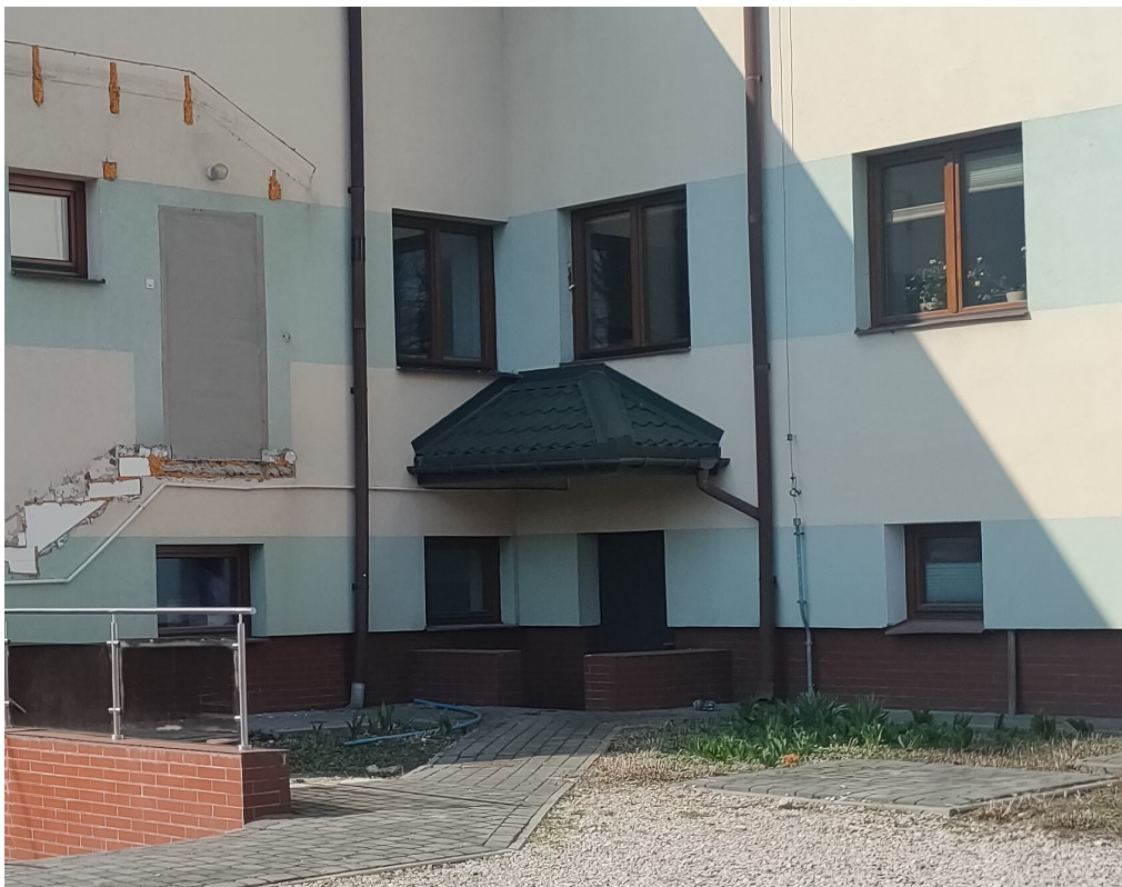
Daszek do rozbiórki nad wejściem do magazyn