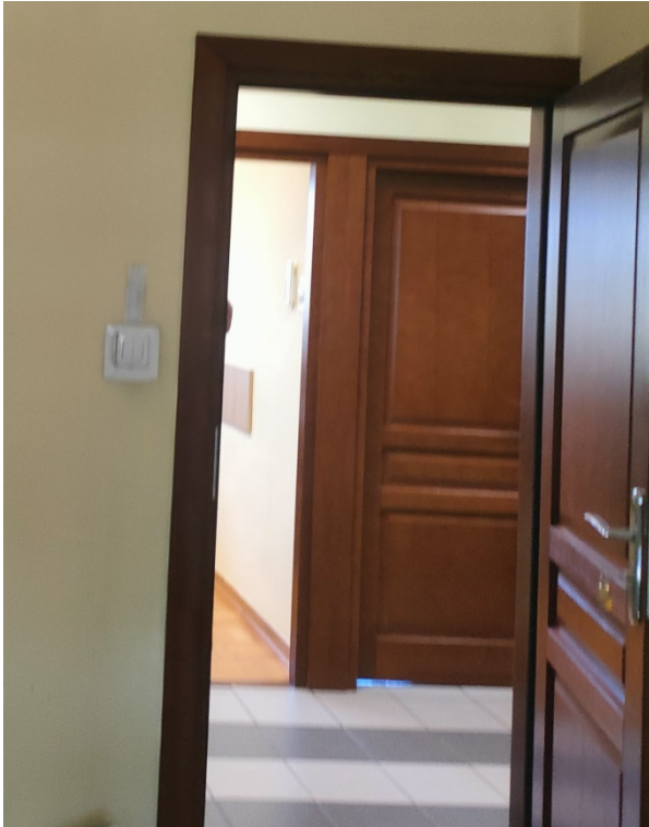
Częściowy widok pokoju biurowego z wyjściem na korytarz do przebudowy na WC dla osób z niepełnosprawnością