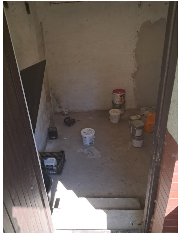
Wejście magazynu w piwnicy do przebudowy Magazyn wewnątrz do remontu